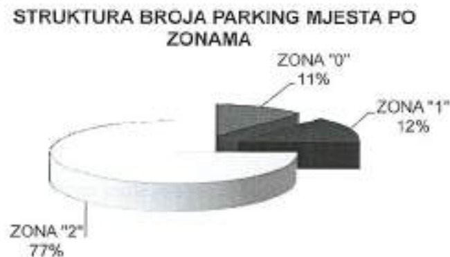
Grafikon 1. Struktura broja parking mjesta po zonama

Stepen iskorištenosti kapaciteta svih javnih parkirališta na kojima se vršila naplata parkiranja 1 po zonama je prikazan na slijedećem grafikonu.